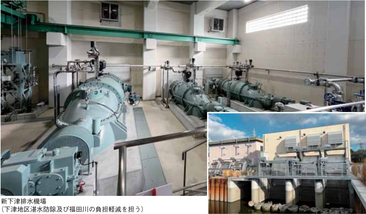
新下津排水機場 (下津地区湛水防除及び福田川の負担軽減を担う)

発行日：令和6年5月吉日 発行所：福田悪水土地改良区 所在地：〒492-8213 稲沢市高御堂一丁目8番2号 TEL：0587-32-1016 FAX：0587-32-4949 E-mail：fukutaakusui@joy.ocn.ne.jp 印刷：(株)プリテックコーポレーション