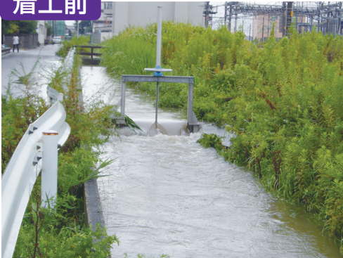
単独土地改良事業 大助川2地区